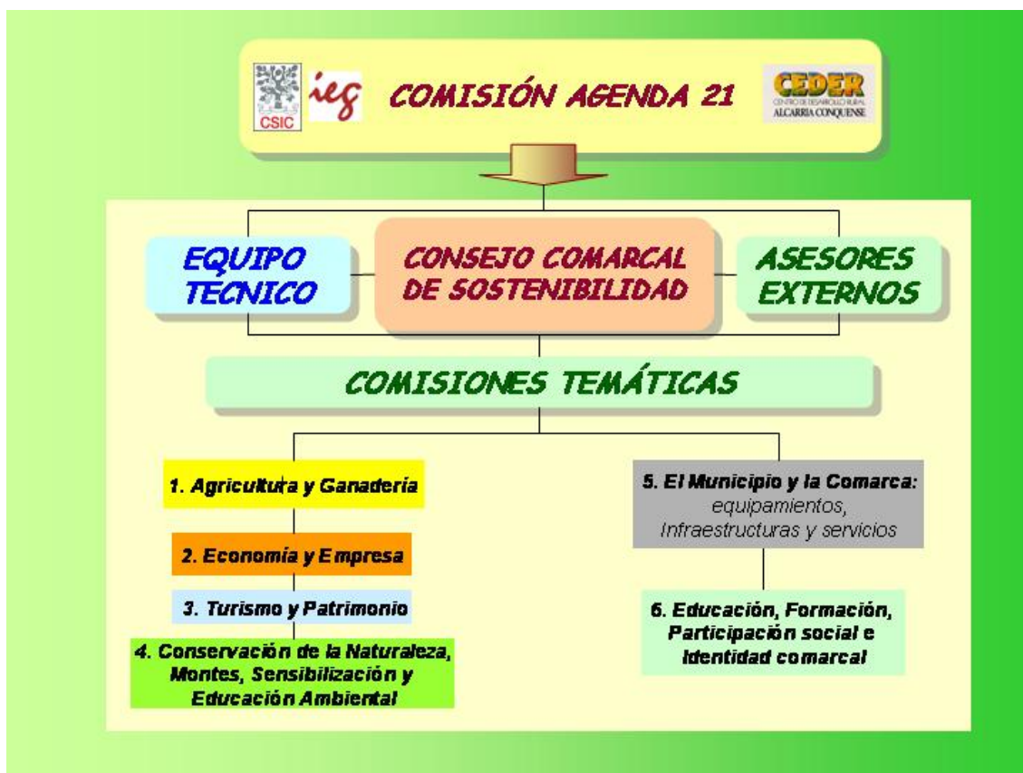
Figura 2: Estructura institucional de la Agenda 21

Para que el proceso de elaboración de la Agenda 21 Comarcal fuese operativo el Equipo Técnico propuso, en abril de 2004, que los órganos e instituciones participantes se organizaran atendiendo a la siguiente estructura: